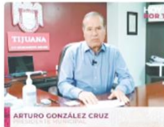
TIJUANA. Se informó sobre las acciones que el XXIII Ayuntamiento de Tijuana lleva a cabo para mejorar la calidad de vida de los ciudadanos.

TIJUANA. Con el propósito de mantener una relación cercana a los tijuaneños, durante la contingencia sanitaria, el presidente municipal, Arturo González Cruz, resolvió las dudas y atendió las peticiones de los ciudadanos, a través de una Conferencia Ciudadana, que se llevó a cabo de forma virtual, a través de las redes sociales oficiales del municipio. "Utilizamos las nuevas tecnologías para respetar los protocolos de salud necesarios, a fin de informar a la comunidad sobre las actividades que hemos estado llevando a cabo, como nuestro programa de servicio móvil de salud, con el que llamamos médicos y equipó a las personas más alejadas de la región, para que los vecinos sean