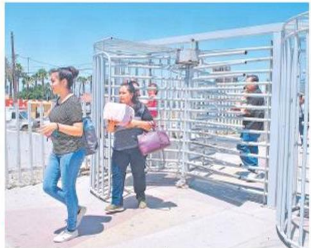
Continúan las restricciones en el cruce terrestre