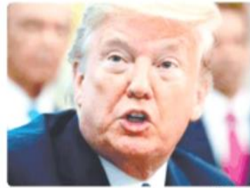
SAN DIEGO. El martes se realizó un análisis de la propuesta de prohibir el ingreso al país a estadounidenses o ciudadanos legales, que sean sospechosos de portar el COVID-19.

El impedimento a entrar al país se basa en un borrador que no especifica si se refiere a estadounidenses que viven en el extranjero, ni menciona a residentes legales que desearían de vivir en Estados Unidos, según su condición migratoria, pero viven en México. El diario The New York Times, que tuvo acceso al borrador del memorándum, informó que en los últimos meses, Trump prohibió la entrada de extranjeros a Estados Unidos, por riesgo de que el virus se propague. Pero esas reglas han eximido a dos categorías de personas que intentan regresar: ciudadanos estadounidenses y no ciudadanos que ya