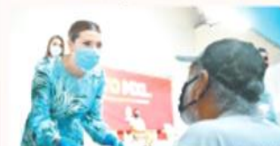
MEXICALI. Recibieron apoyo económico residentes de la ciudad, el valle y San Felipe, que sufrieron daños en su vivienda.

MEXICALI. En apoyo a familias que fueron afectadas en su patrimonio por la pérdida total o parcial de su vivienda, la Presidenta Municipal